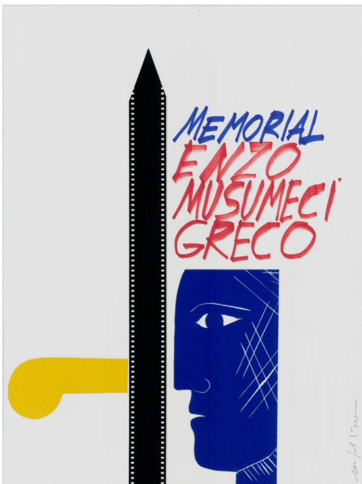
Disegno di Mimmo Paladino