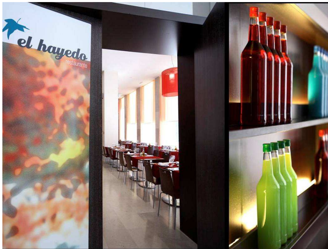
Restaurante El Hayedo

Restaurante El Hayedo | Barceló Torre Arias